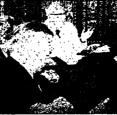
اللجنة النيابية للعمل والموازنة في قصر منصور